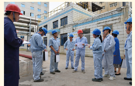
在新昌制药厂慰问。