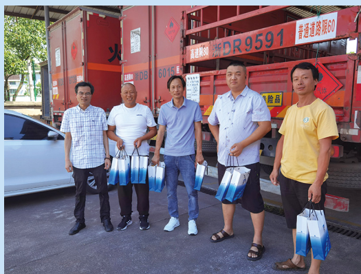
慰问新昌制药厂车队货车司机。