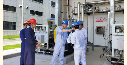
在昌海生物产业园慰问。