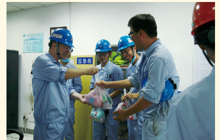
在昌海生物产业园慰问。