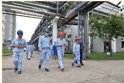
在新昌制药厂慰问。