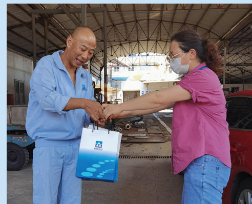
慰问新昌制药厂机修车间职工。