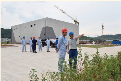
在可明生物项目建设现场慰问。