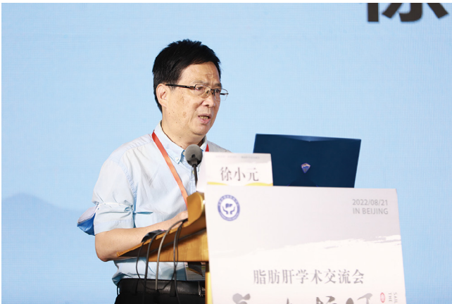
中华医学会肝病分会主任委员徐小元教授致辞