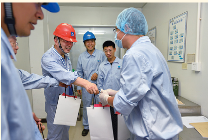
在新昌制药厂慰问。