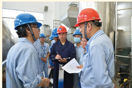
在新昌制药厂慰问。章忠阳 摄