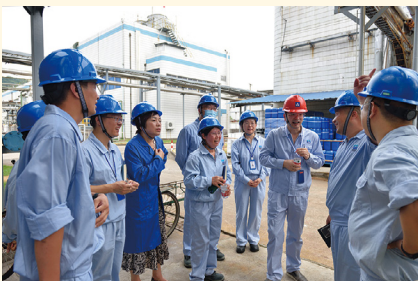
在新昌制药厂慰问。