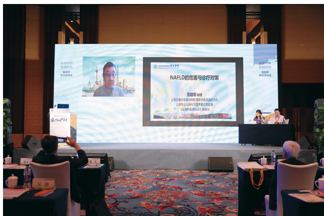
上海新华医院范建高教授解读脂肪肝危害