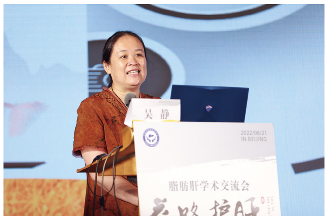
中国疾控中心慢病中心吴静主任解读中国慢病防控政策