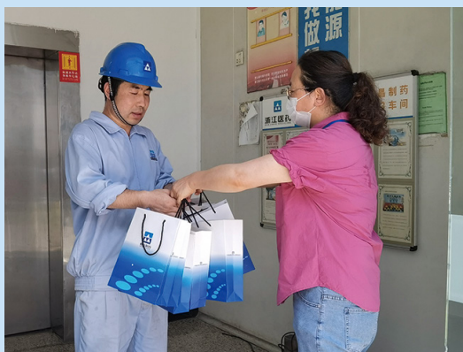
慰问新昌制药厂保健品分厂热喷岗位职工。