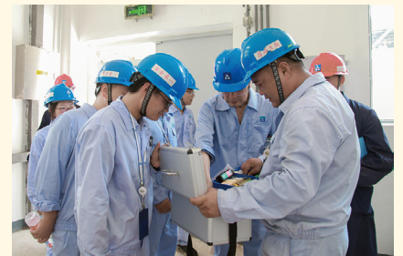
在昌海生物产业园慰问。任小萍 摄