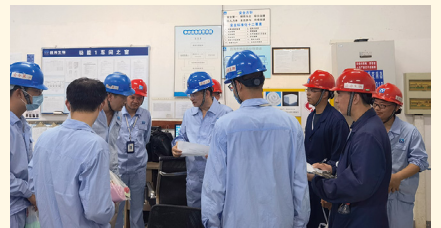
在昌海生物产业园慰问。