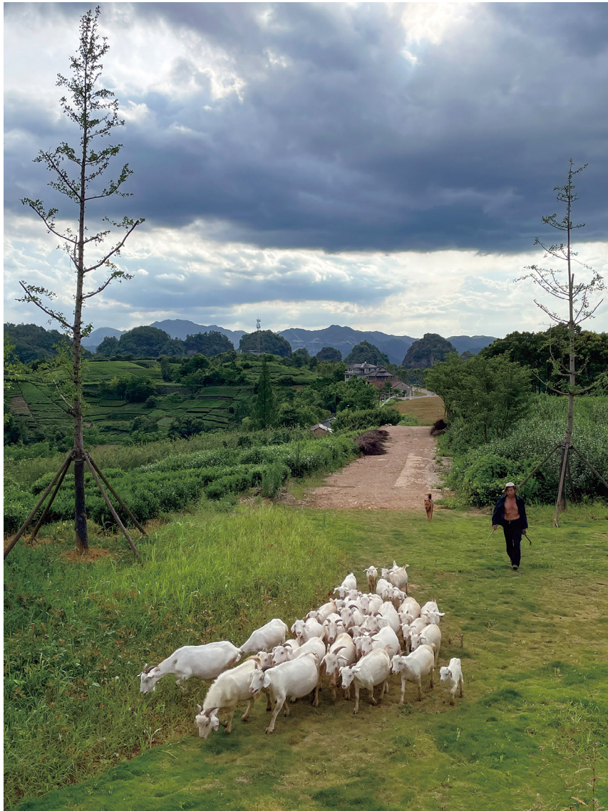
员工艺萃 摄影作品《牧归》 沈钢 摄