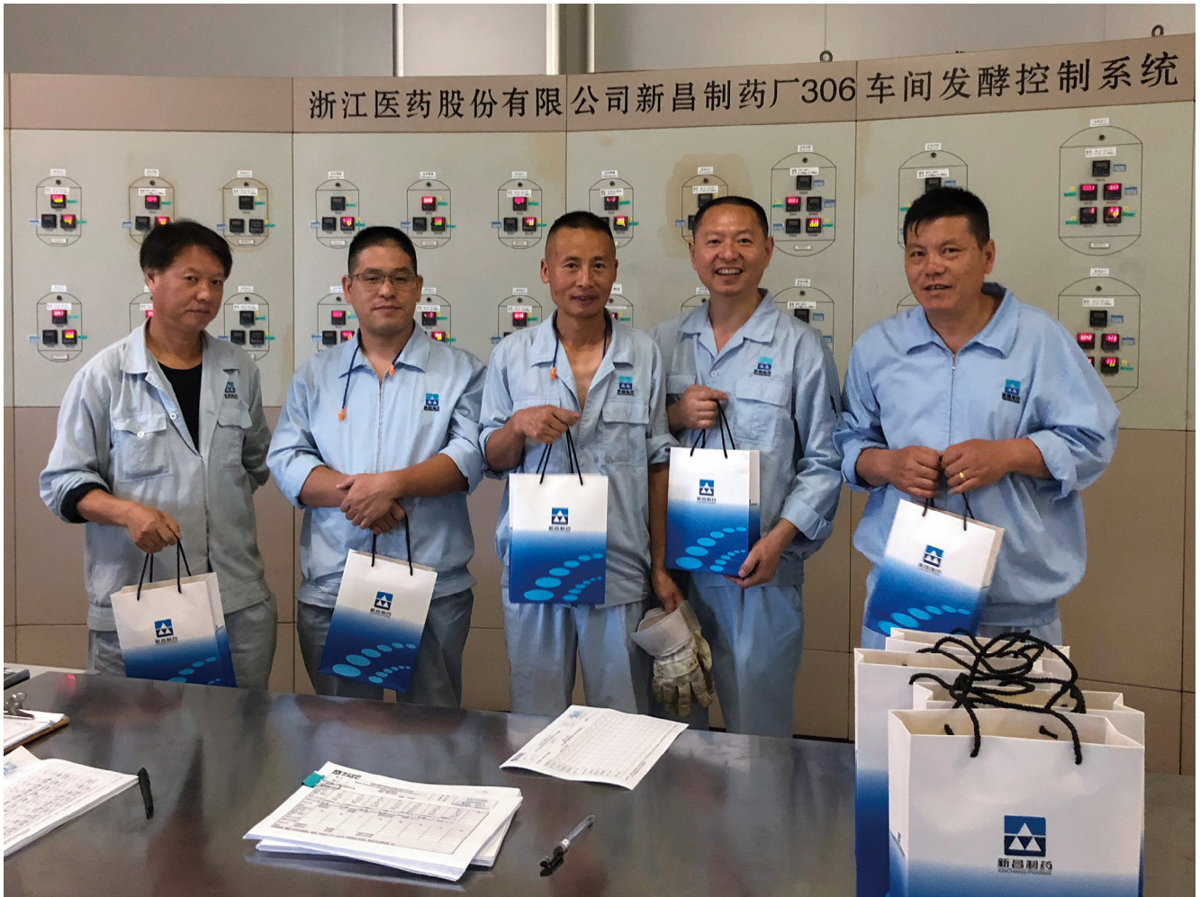
慰问新昌制药厂生物药物分厂发酵岗位职工。