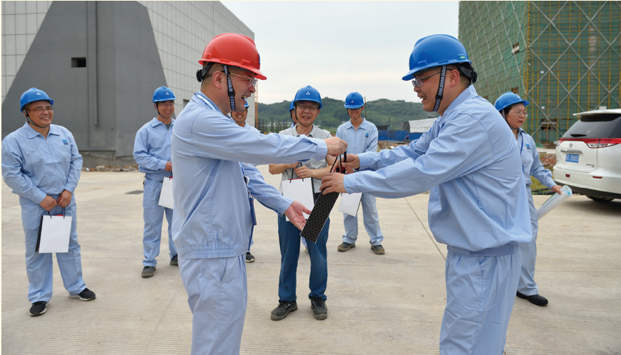
在可明生物项目建设现场慰问。