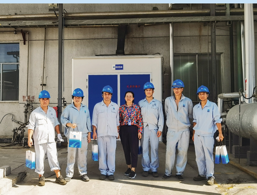
慰问新昌制药厂保健品分厂设备科职工。