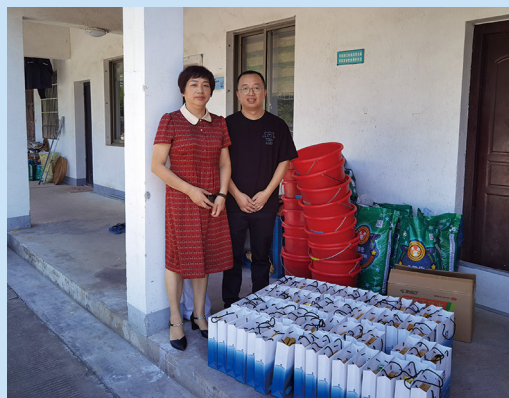
在来益生态农业园慰问。