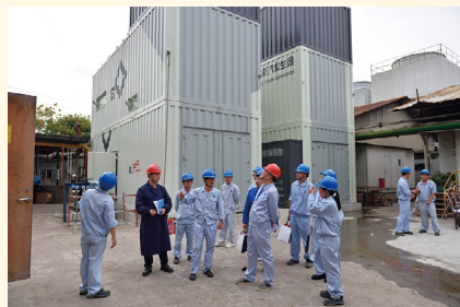
在新昌制药厂慰问。