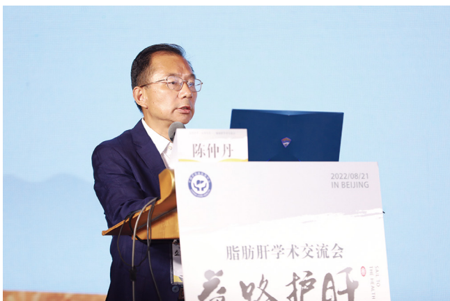
世界卫生组织驻华代表处陈仲丹博士致辞

近年来的流行病学数据显示,非酒精性脂肪性肝病(NAFLD,简称“脂肪肝”)已成为我国罹患人数第一的慢性肝病,中国大陆地区患病率高达30%,总人数超3亿。如不及时干预,我国将有大量人群从早期单纯脂肪肝进展,成为非酒精性脂肪性肝炎(NASH),甚至向肝纤维化、肝硬化、肝癌发展,给社会家庭个人造成沉重医疗负担。目前,我国NASH患者数量已突破3300万。